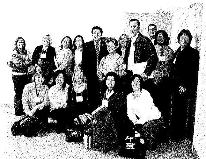
Integrantes de la PTA del Noveno Distrito en el Safari a Sacramento

Busque a la persona de su consejo o la PTA del Noveno Distrito y pídale hablar a su asociación sobre abogacía. Posibilite la asistencia el año próximo al incorporar este gasto a su presupuesto.